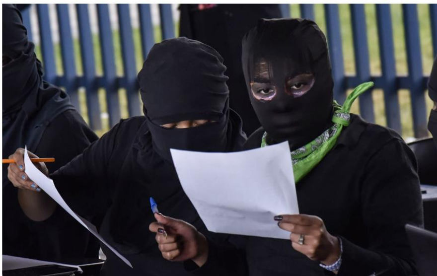
Mujeres Organizadas de la Facultad de Filosofía y Letras (MOFFyL) sostuvieron un diálogo público con autoridades.

No es sólo Filos o Ciencias Políticas. Durante casi cuatro meses, mujeres de al menos 23 planteles de la UNAM han realizado paros, protestas, huelgas, y otras actividades contra la violencia y acoso sexual. Las movilizaciones crecen; ellas acusan que sus denuncias no siguen sin ser atendidas. Este Martes, convocan a paro general.