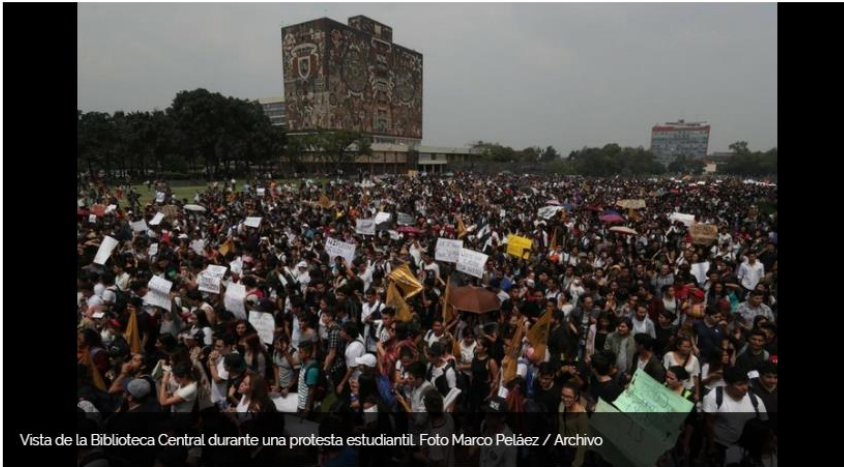
Vista de la Biblioteca Central durante una protesta estudiantil.

Facebook Twitter Correo WhatsApp Pinterest Meneame LinkedIn