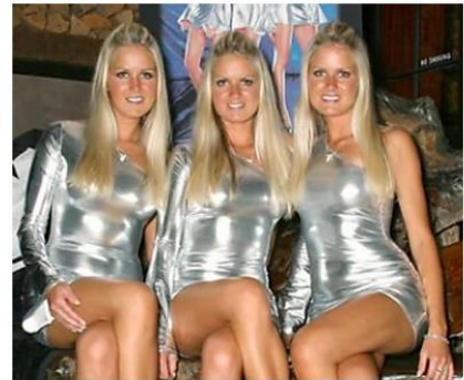
Los trillizos hacen una prueba de ADN y el médico revela noticias dolorosas

Presidente: la UNAM es una valiosa institución del Estado. La desestabilización de la casa de estudios apunta sin remedio al Estado y al gobierno que usted preside. Las instituciones del gobierno no pueden ni deben escudarse en la autonomía universitaria para no utilizar los instrumentos de inteligencia necesarios para poner a la luz los intereses nefandos de quienes manipulan a las y los encapuchados.