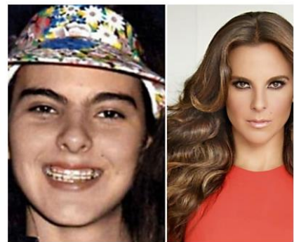
Kate del Castillo y 39 famosos poco agradados de jóvenes